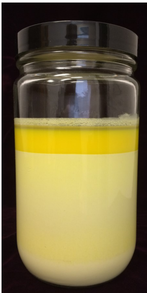
Standard Primärtauchmasse Ablagerung nach 24 Stunden